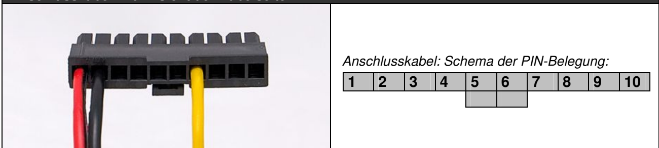
Anschlusskabel mit Ansicht der Kabelseite

Es ist zu gewährleisten, dass auch nach ausschalten der Zündung das Spannungspotential zur Verfügung steht.